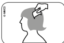
Abb. Durchkämmen des nassen Haares mit Läusekamm vom Haaransatz bis zu den Haarspitzen